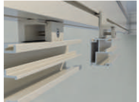
Aussenbündige oder eingerückte Montagemöglichkeit