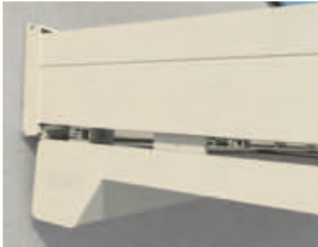
Klare Linienführung im Übergang Kasten zu Ausfallprofil