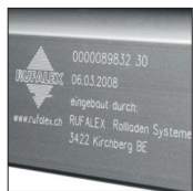
Jeder Rollladen ist ein Unikat und ist auf der Endschiene mit einer ID-Nummer versehen. Alle verbauten Teile können unter www.rufalex.ch/idsuche aufgerufen werden