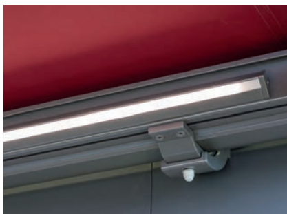
Direkte Beleuchtung beim PERGOLINO: Die «Einschnapp-Technik» ermöglicht eine unauffällige Anbringung.