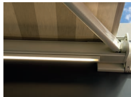
Auch bei nachträglicher Montage wie hier bei der TENDABOX ergibt sich ein homogenes Aussehen.